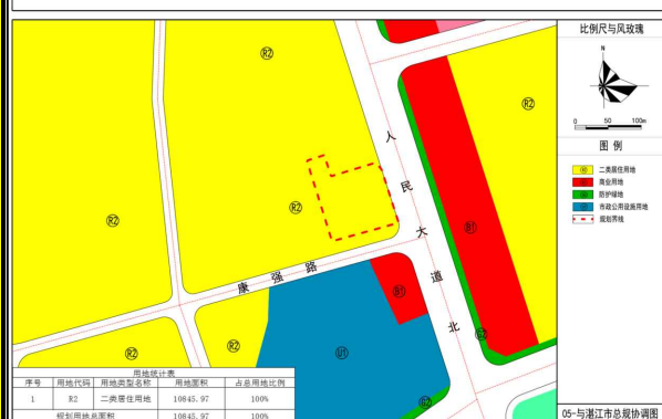
湛江市赤坎区人民大道北59号地块控制性详细规划